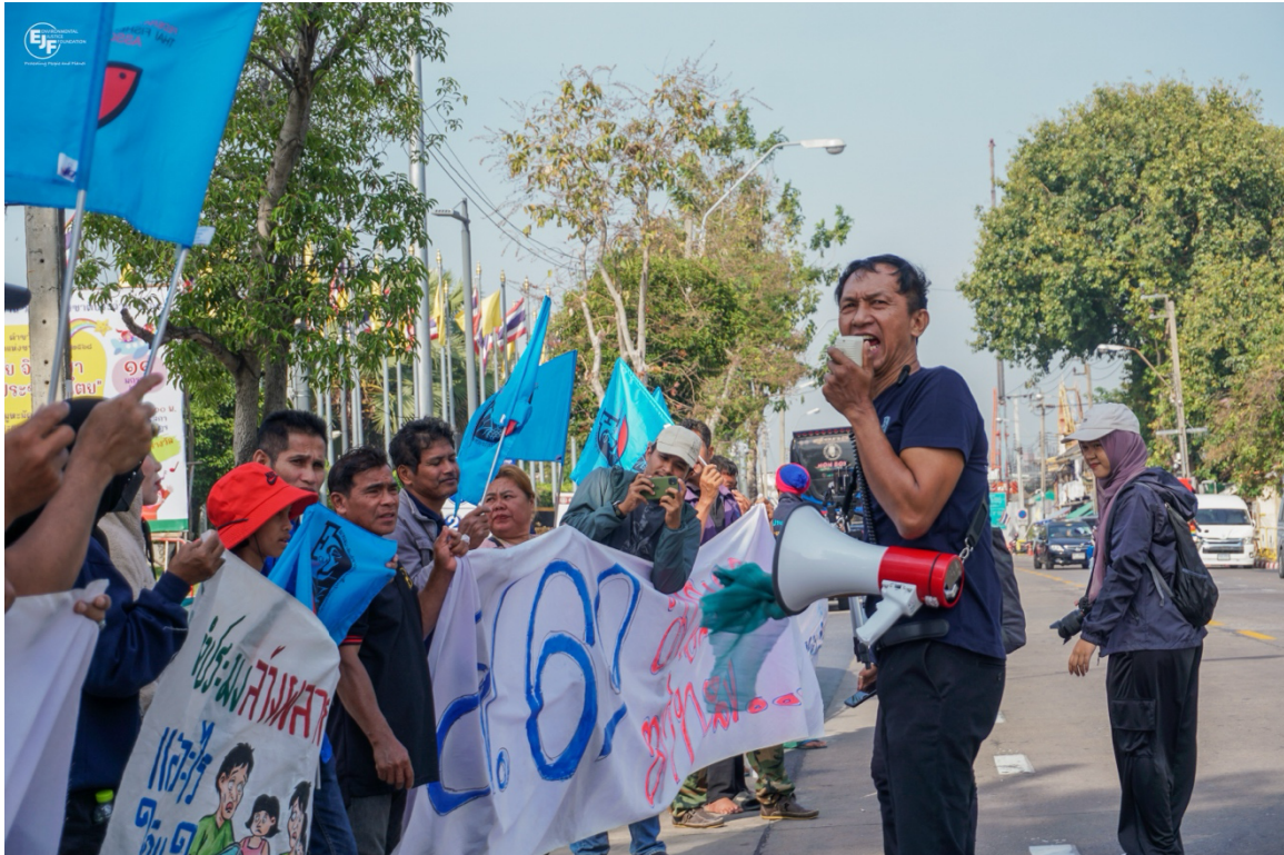
เครือข่ายชาวประมงพื้นบ้านร่วมตัวแสดงความกังวลเกี่ยวกับร่างพระราชบัญญัติการประมงขณะสภาผู้แทนราษฎรกำลังพิจารณาวาระ 2-3 ณ รัฐสภา เมื่อวันที่ 25 ธันวาคม พ.ศ. 2567 7

การขาดการรับฟังเสียงของกลุ่มประมงพื้นบ้าน แรงงานข้ามชาติ และผู้มีส่วนได้ส่วนเสียในท้องถิ่นอื่น ๆ ทำให้ร่างฉับ กรรมาธิการฯ เสี่ยงต่อการรวมศูนย์อำนาจไว้ที่กลุ่มอุตสาหกรรมประมงขนาดใหญ่ ทั้งยังทำลายความพยายามในการจัดการ ทรัพยากรที่ซับซ้อนโดยชุมชน การขาดการมีส่วนร่วมจากประชาชนอย่างแท้จริงอาจส่งผลให้พระราชบัญญัติการประมงของ ประเทศไทยฉบับใหม่นี้บั่นทอนทั้งความยั่งยืนด้านสิ่งแวดล้อมและความเป็นธรรมทางสังคม การใช้แนวทางการมีส่วนร่วมจะช่วย ส่งเสริมกฎระเบียบที่ไม่เพียงแต่รับผิดชอบต่อสิ่งแวดล้อมเท่านั้น แต่ยังมีคุณธรรมในเชิงเศรษฐกิจและสังคม และสอดคล้องกับ มาตรฐานสากลด้านการพัฒนาอย่างยั่งยืนและยั่งยืนสิทธิของชุมชน